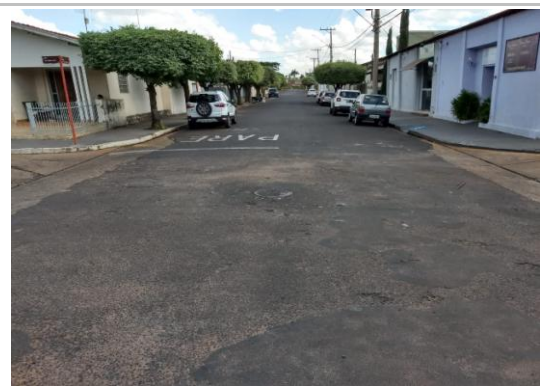
Trecho 05 - Rua Aurora Soares Gerales (Ângulo Oposto) 20°44'06.7"S 49°35'07.7"W