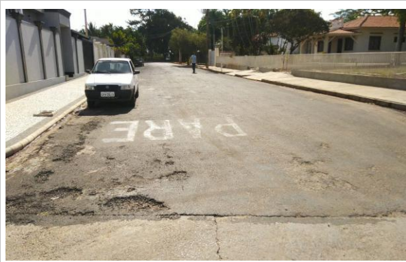
Trecho 10 - Rua Pará 20°43'58.4"S 49°35'02.0"W