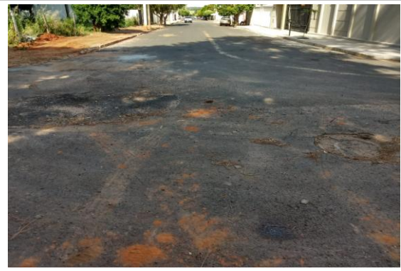
Trecho 10 - Rua Pará (Ângulo Oposto) 20°43'56.7"S 49°35'04.8"W