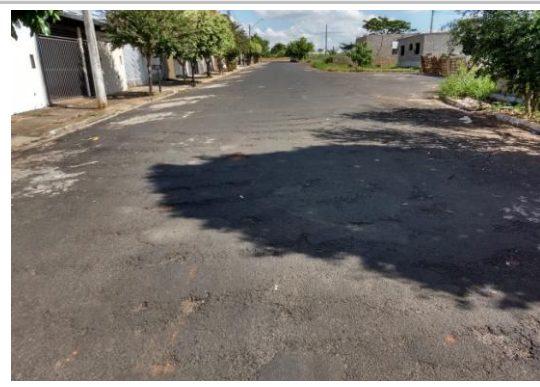
Trecho 06 - Rua Cândido Soler Geres (Ângulo Oposto) 20°44'33.9"S 49°34'30.9"W