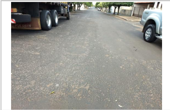
Trecho 07 - Rua Dr. Alberto Andaló 20°44'06.0"S 49°35'15.5"W