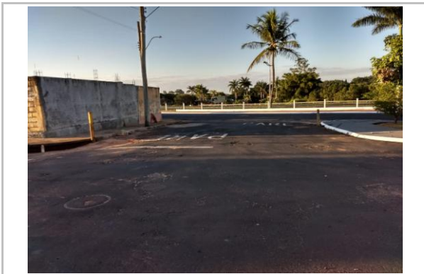
Trecho 08 - Rua Euclides Borghezán 20°44'07.8"S 49°34'33.6"W