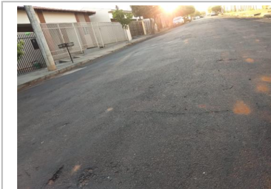
Trecho 02 - Rua Alagoas (Ângulo Oposto) 20°44'07.8"S 49°34'33.8"W