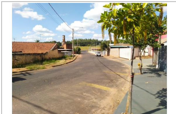
Trecho 01 - Avenida Brasil 20°44'26.7"S 49°34'17.5"W