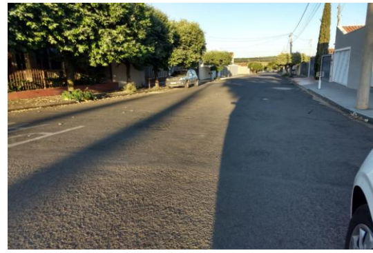
Trecho 04 - Rua Alagoas (Ângulo Oposto) 20°43'56.9"S 49°34'51.9"W