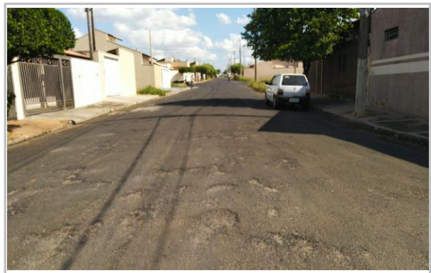
Trecho 09 - Rua João Lourenço Munhoz 20°44'25.3"S 49°34'33.3"W