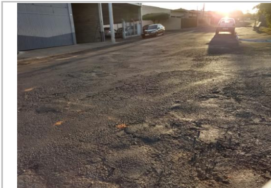
Trecho 03 - Alagoas (Ângulo Oposto) 20°44'08.5"S 49°34'32.3"W