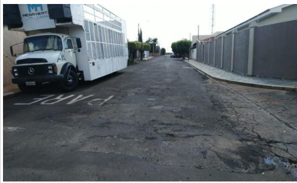
Trecho 04 - Rua Alagoas 20°43'58.6"S 49°34'48.8"W