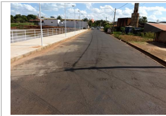
Trecho 01 - Avenida Brasil (Ângulo Oposto) 20°44'27.7"S 49°34'22.3"W