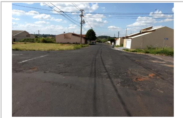
Trecho 09 - Rua João Lourenço Munhoz 20°44'27.1"S 49°34'34.6"W