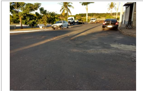
Trecho 03 - Alagoas 20°44'07.8"S 49°34'33.8"W