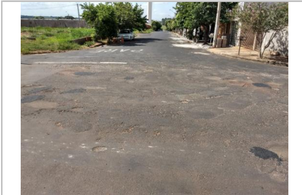
Trecho 06 - Rua Cândido Soler Geres 20°44'37.4"S 49°34'33.5"W