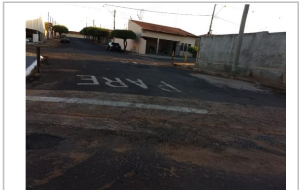
Trecho 08 -Rua Euclides Borghezán (Ângulo Oposto) 20°44'07.4"S 49°34'33.4"W