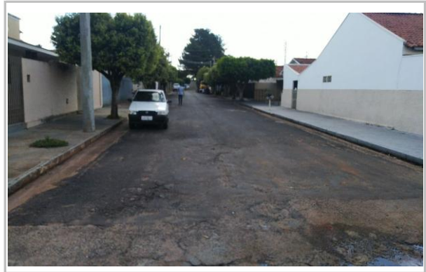
Trecho 07 - Rua Dr. Alberto Andaló (Ângulo Oposto) 20°44'07.6"S 49°35'12.8"W