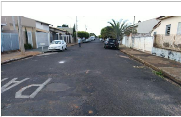
Trecho 05 - Rua Aurora Soares Gerales 20°44'09.5"S 49°35'09.7"W